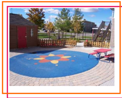
Phase 2 (32,000$)